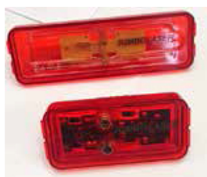
| 車燈打標 |