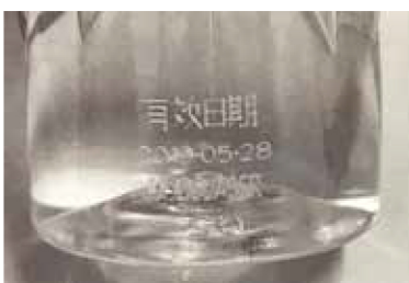
| 寶特瓶打標 |